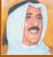
حضرة صاحب السمو الشيخ صباح الأحمد الجابر الصباح رئيس مجلس الوزراء