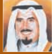
حضرة صاحب السمو الشيخ جابر الأحمد الجابر الصباح أمير دولة الكويت