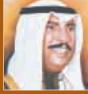
حضرة صاحب السمو الشيخ سعد العبدالله السالم الصباح ولي العهد لدولة الكويت